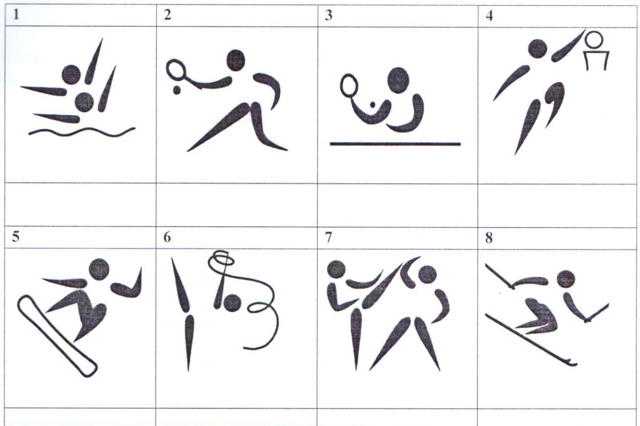
Ж) Задание-кроссворд 29.